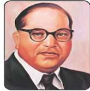
டாக்டர். பி.ஆர். அம்பேத்கர்